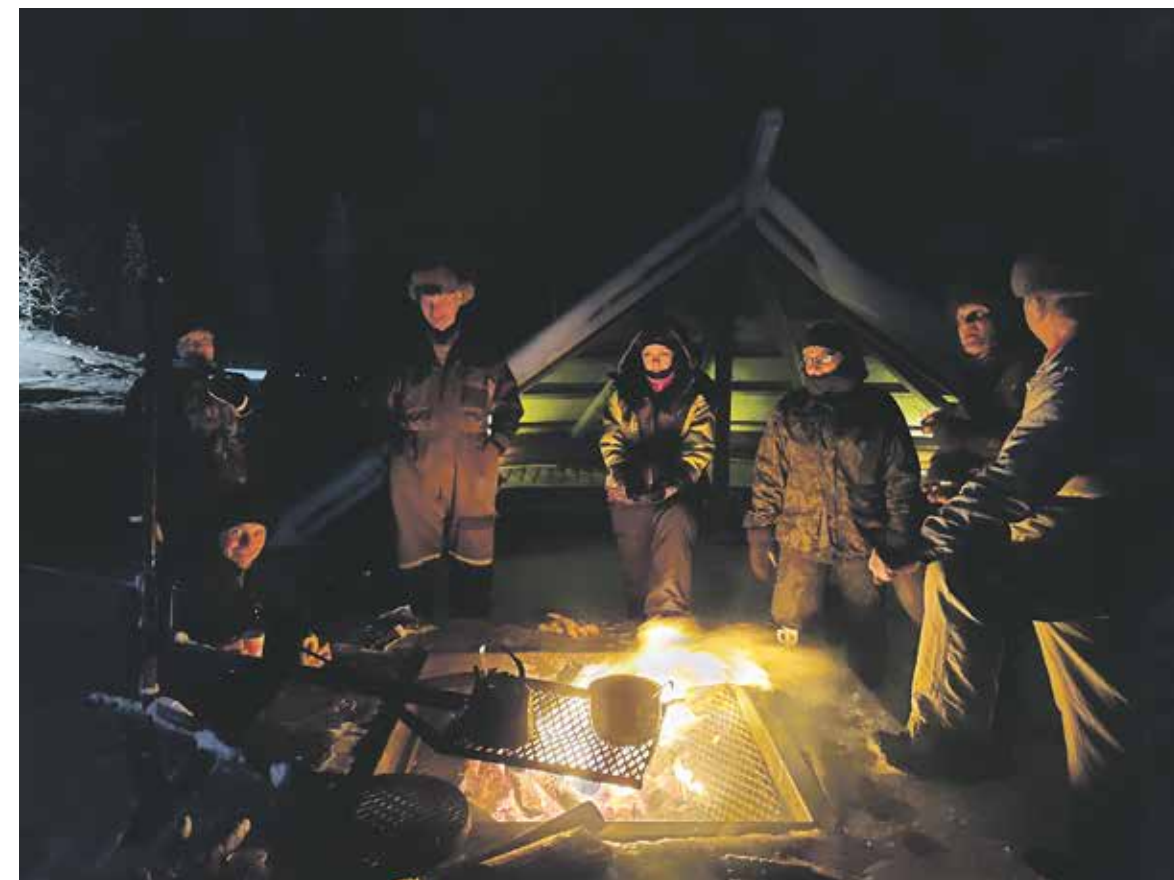
Pikkujoulumakkaraa Saukkovaaran laavulla.