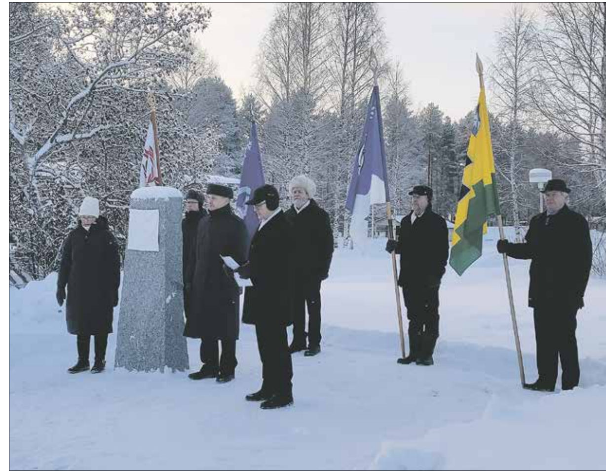
Suomelan muistolaatan juhlallinen paljastustilaisuus.

Uutta laatan sijoituspaikkaa ryhdyttiin pohtimaan välittömästi. Vauhtia hanke sai, kun Ristijärven Perinnetoimikunnan kokouksessa marraskuussa 2022 päätettiin, että laatta kiinnitetään paikkakunnan graniitista louhittuun paateen.