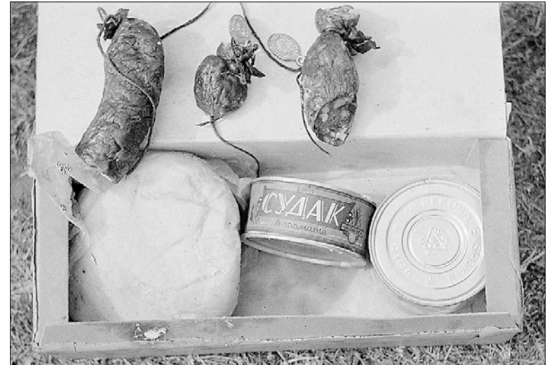
Tällä pidätetyllä desantilla oli eväinä ainakin metvurstin tapaista makkaraa ja säilykkeitä.