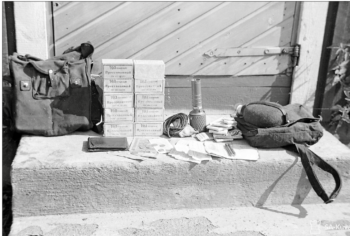
Vuonna 1941 vangitun desantin varusteet, joukossa muun muassa suomalaista rahaa, elintarvikkeitä, henkilökohtaisia esineitä.

Kaikille avoimet Marttailat Ristijärven Marttalassa