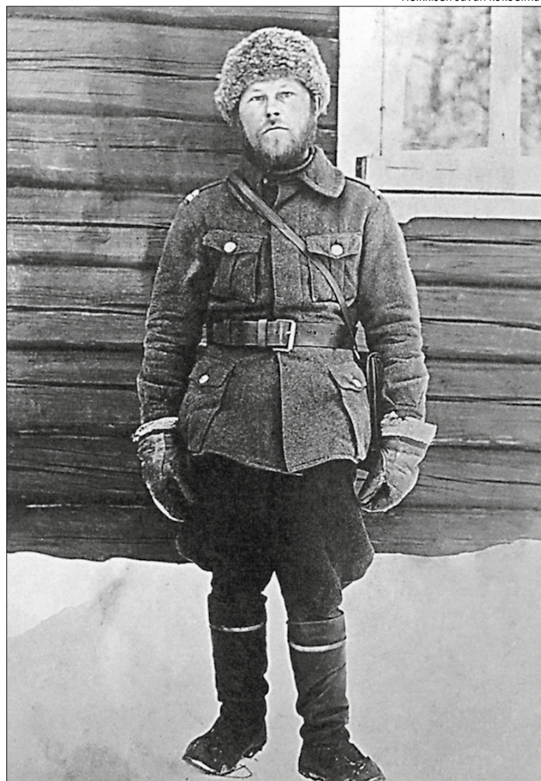
Heikkisen suvun kokoelmat

Kaikille annettiin suurin piirtein samanlainen tehtävä, ja missään nimessä ei saanut ajautua taisteluun suomalaisten sotilaiden kanssa. Ilman aatteellista taustaa ole-